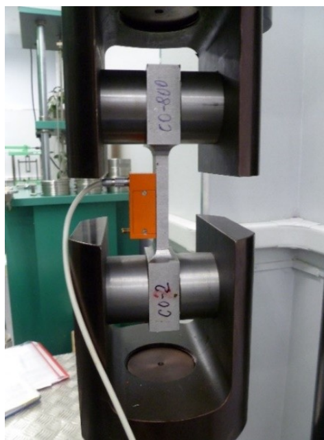
Рис 1. Применяемый при ИЦУТ прибора ИН-5101А экземпляр СО-2 стандартного образца СО-800 с закреплённым 3-х компонентным первичным преобразователем, установленный в эталонную силовоспроизводящую машину МСВ-1000МГ4.

На рисунке 1 показан экземпляр СО-2 стандартного образца СО-800, установленный в эталонную силовоспроизводящую машину, в процессе испытаний в целях утверждения типа прибора ИН-5101А,